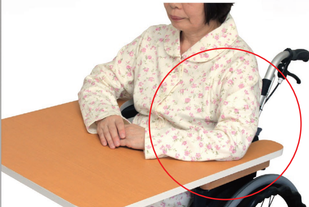
どこでもテーブル使用時