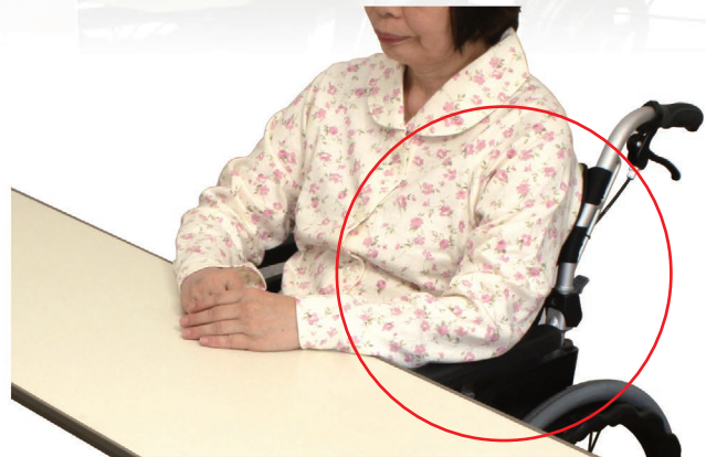
一般のテーブル使用時